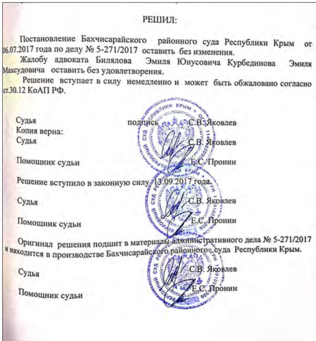
Фрагмент рішення «Верховного суду» Криму, яке залишило чинним рішення «Бахчисарайського районного суду» щодо штрафу в 150 000 рублів стосовно Еміля Билялова, 13 вересня 2017 р.