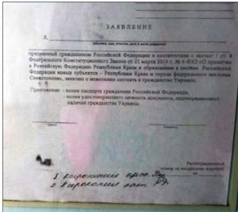
Образец заявления об отказе от гражданства Украины в ФМС Крыма