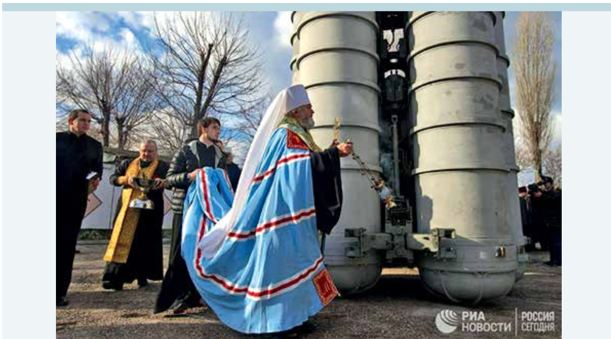
Фото 10. Освящение ракетных систем С-400 в Феодосии.

14 января 2017 года в военной части в Феодосии состоялся ритуал освящения зенитных ракетных систем С-400 «Триумф» 122 .