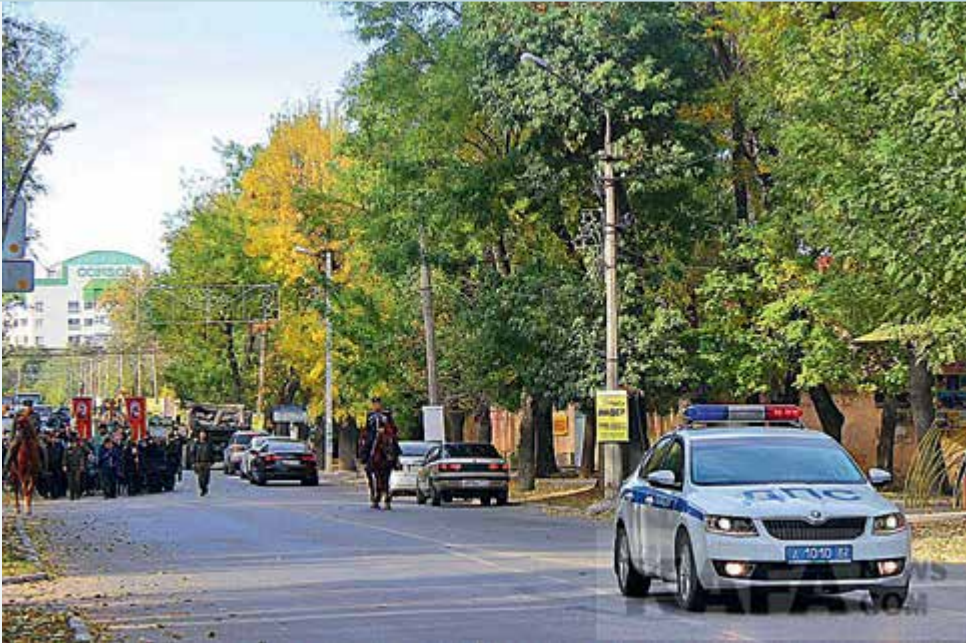
Фото 11. Крестный ход в Феодосии, 3 ноября 2017 года.

20 июля 2017 года в Симферополе прошел крестный ход, посвященный крещению Киевской Руси, в котором участвовало около 500 человек 123 .