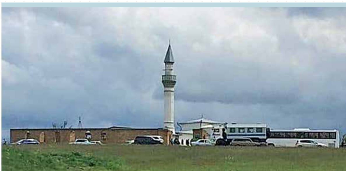
Фото 3. Обыск в мечети села Вишенное, 13 мая 2016 года.

13 мая 2016 года, в пятницу, прошел обыск в мечети села Вишенное Белогорского района. 77