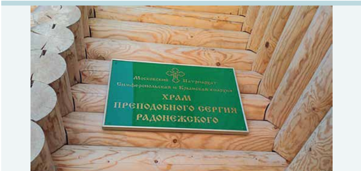
Фото 8. Табличка храма Преподобного Сергия Радонежского, сентябрь 2017 года.

В сентябре 2017 года появилась информация, что на храмах, принадлежащих УПЦ МП, указано «Московский патриархат Симферопольская и Крымская епархия». Как сообщил архиепископ УПЦ МП Климент, Крымская епархия до сих пор в составе УПЦ, а таблички на храмах не являются официальными документами 119 .