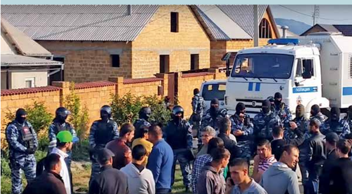
Фото 4. Задержание мусульман в Бахчисарае, 12 мая 2016 года. Скриншот

Их так же помимо участия в террористической организации обвинили в попытке насильственного захвата власти.