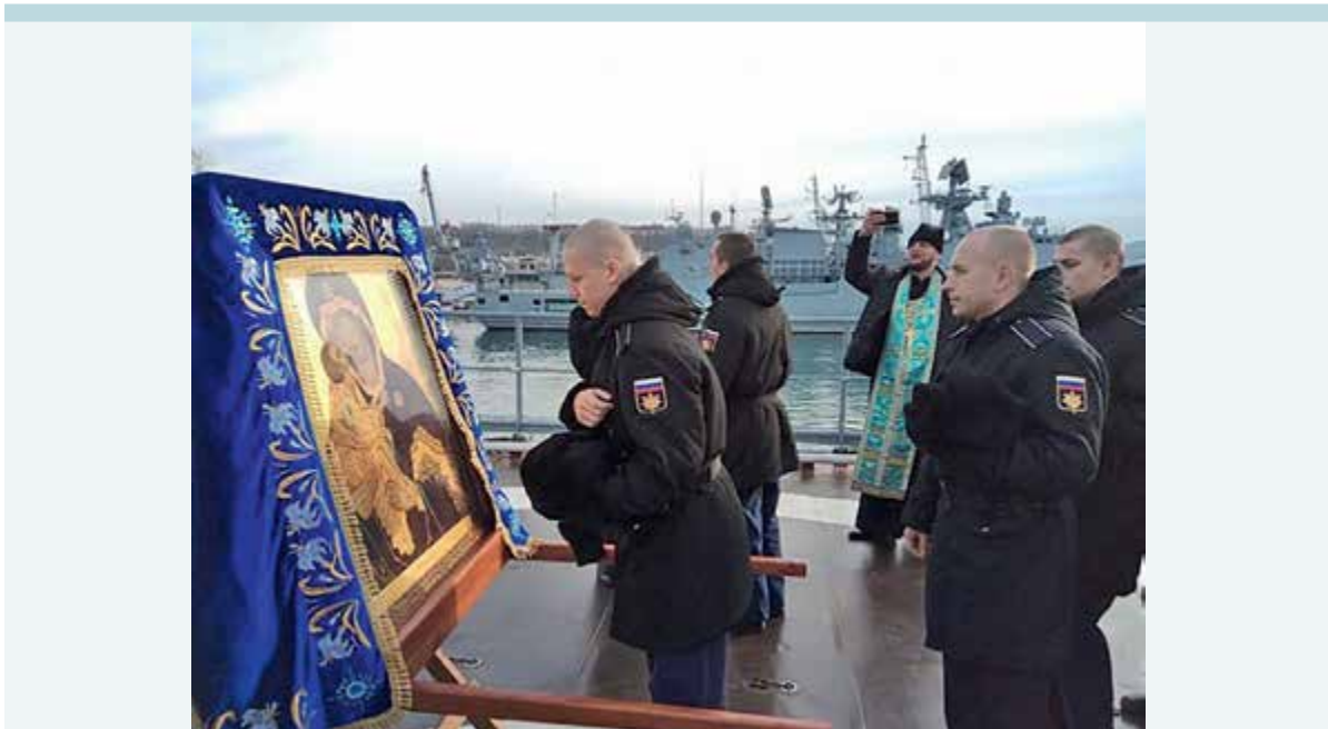
Фото 12. Икона Донской Божьей матери на крейсере Москва, 3 января 2018 года.

С 1 по 3 ноября 2017 года из Топловского женского монастыря в Феодосию (около 40 км) прошел крестный ход, в котором приняло участие несколько сотен человек. В шествии также принимали участие представители парамилитарных формирований.