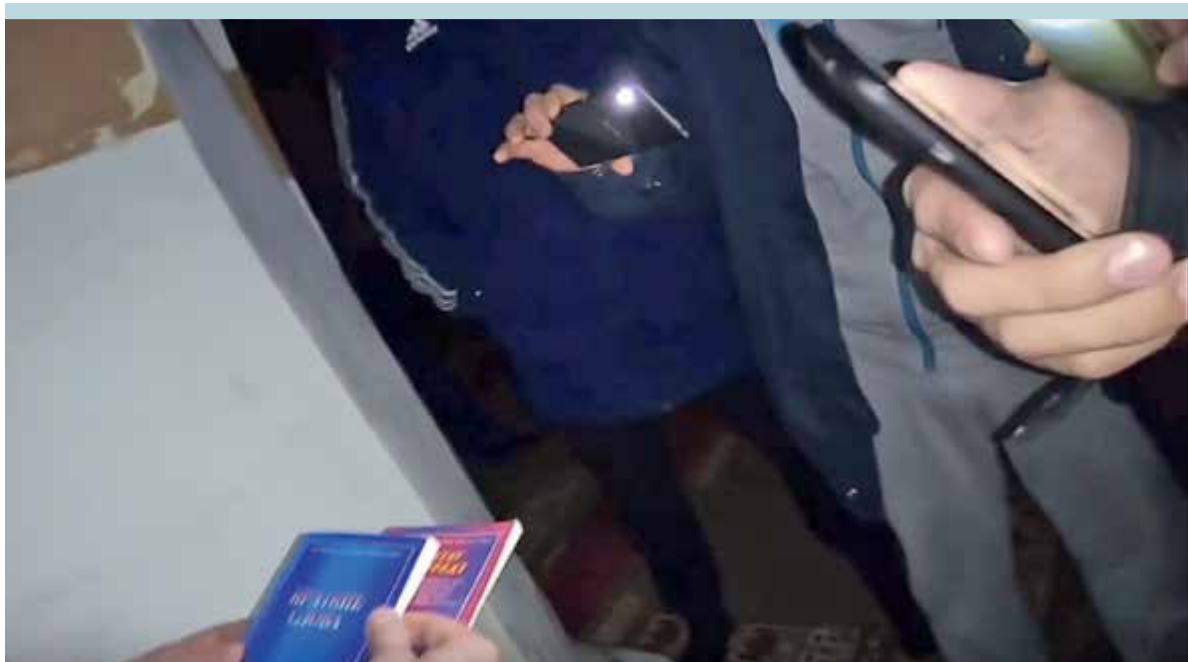
Фото 2. Обыск в мечети Хан-Джами, Евпатория, 14 ноября 2016 года.