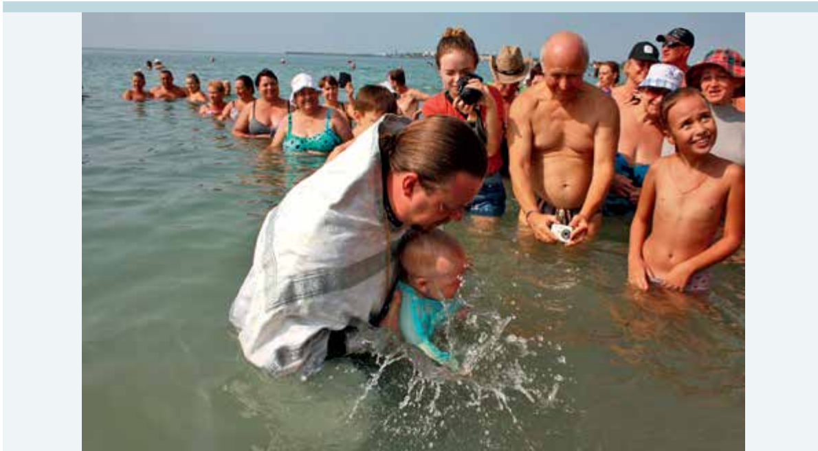
Фото 9. Массовое крещение в Евпатории, 29 июля 2016 года.

29 июля 2016 года (после вступления в силу изменений «пакета Яровой») в Евпатории прошло массовое крещение в море 121 .