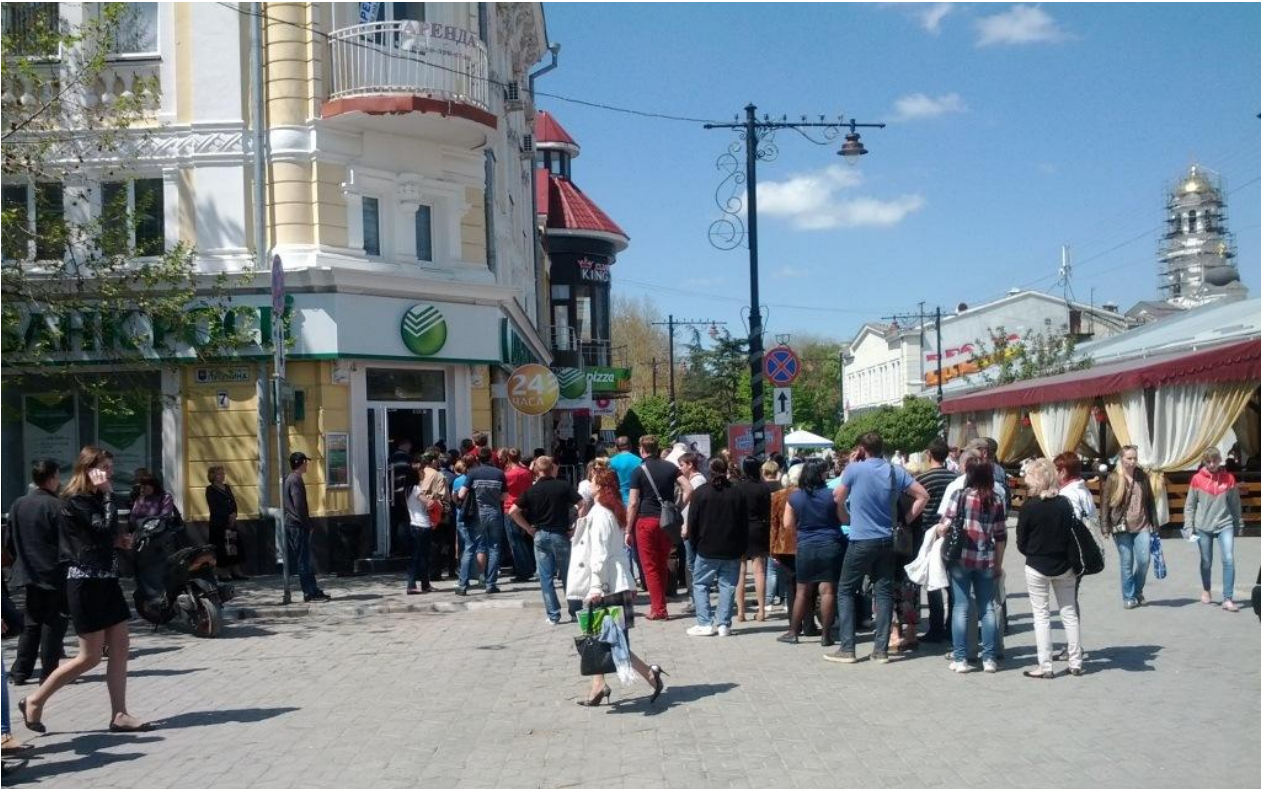
Очередь в Российский банк на углу улиц Пушкина / К.Маркса, г. Симферополь - 22 апреля 2014 года

Власти Украины заявили, что всем гражданам, сохранившим гражданство Украины, выплата пенсий и социальных пособий будет продолжена в полном объеме. Правда, сейчас не ясно, когда восстановится полноценное банковское обслуживание частных лиц. Во всяком случае, сейчас прорабатывается вопрос выплаты пенсий и пособий жителям Крыма в ближайших к Крыму областях Украины по банковским картам.